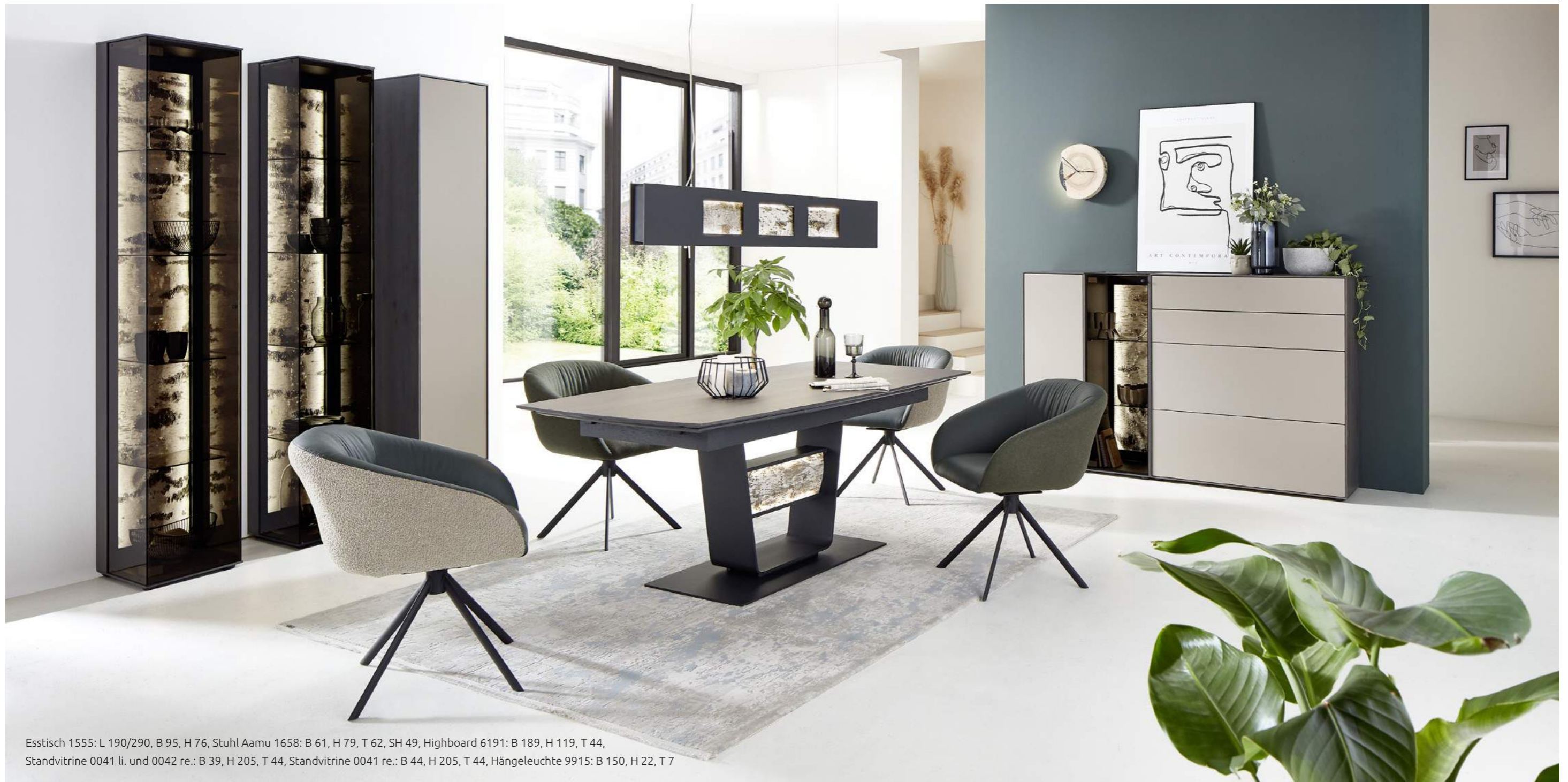
Esstisch 1555: L 190/290, B 95, H 76, Stuhl Aamu 1658: B 61, H 79, T 62, SH 49, Highboard 6191: B 189, H 119, T 44, Standvitrine 0041 li. und 0042 re.: B 39, H 205, T 44, Standvitrine 0041 re.: B 44, H 205, T 44, Hängeleuchte 9915: B 150, H 22, T 7