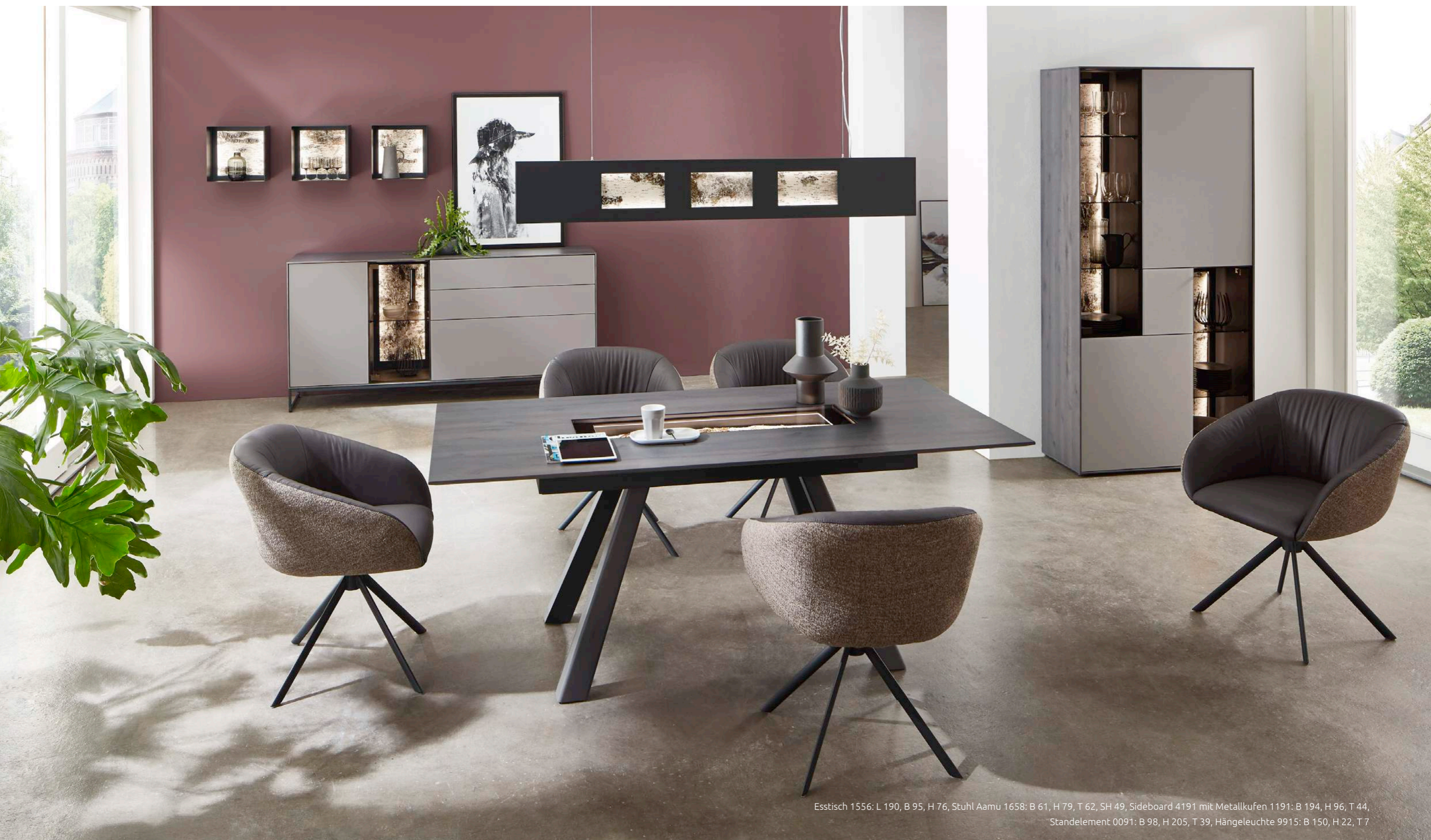
Esstisch 1556: L 190, B 95, H 76, Stuhl Aamu 1658: B 61, H 79, T 62, SH 49, Sideboard 4191 mit Metallkufen 1191: B 194, H 96, T 44, Standelement 0091: B 98, H 205, T 39, Hängeleuchte 9915: B 150, H 22, T 7