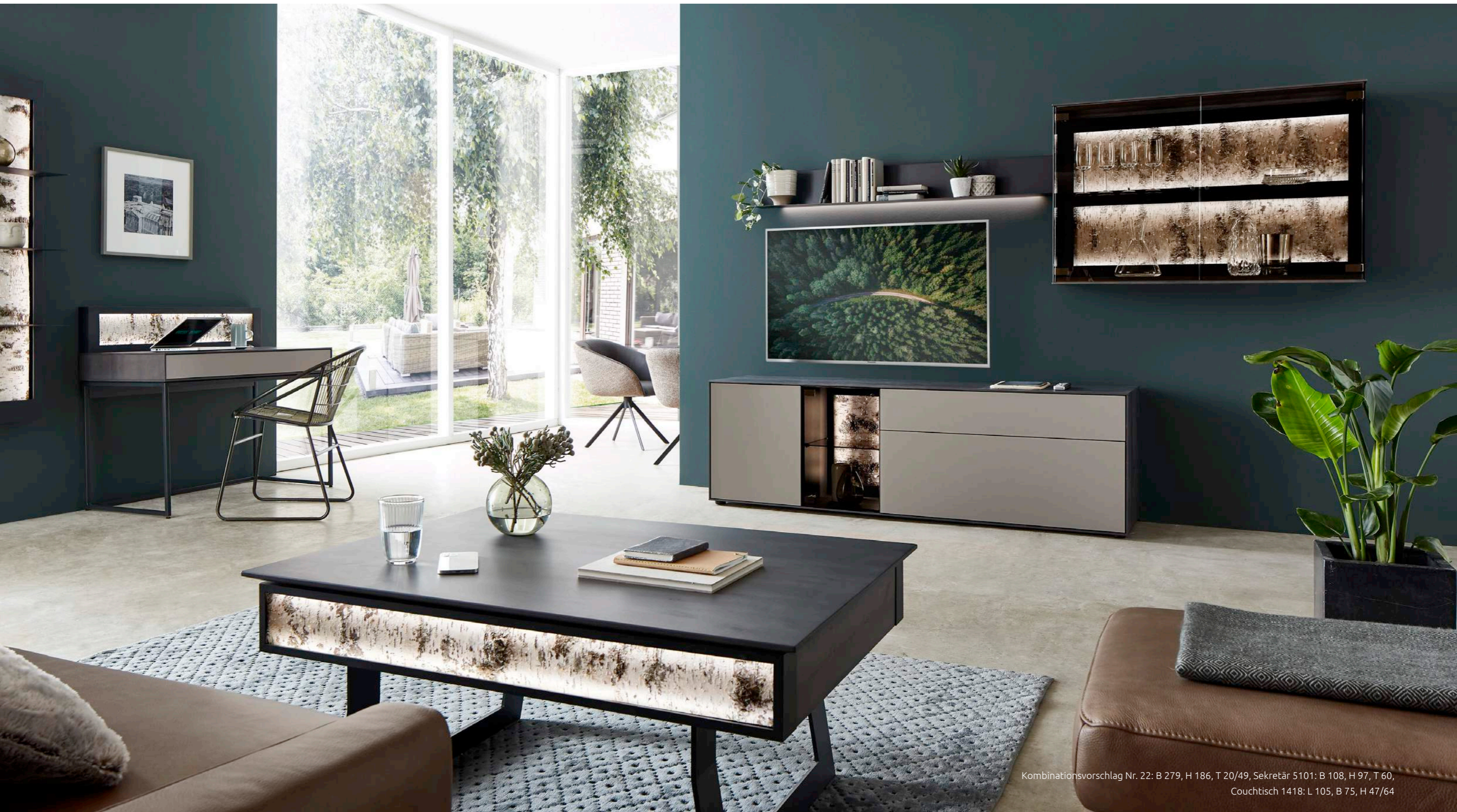
Kombinationsvorschlag Nr. 22: B 279, H 186, T 20/49, Sekretär 5101: B 108, H 97, T 60, Couchtisch 1418: L 105, B 75, H 47/64