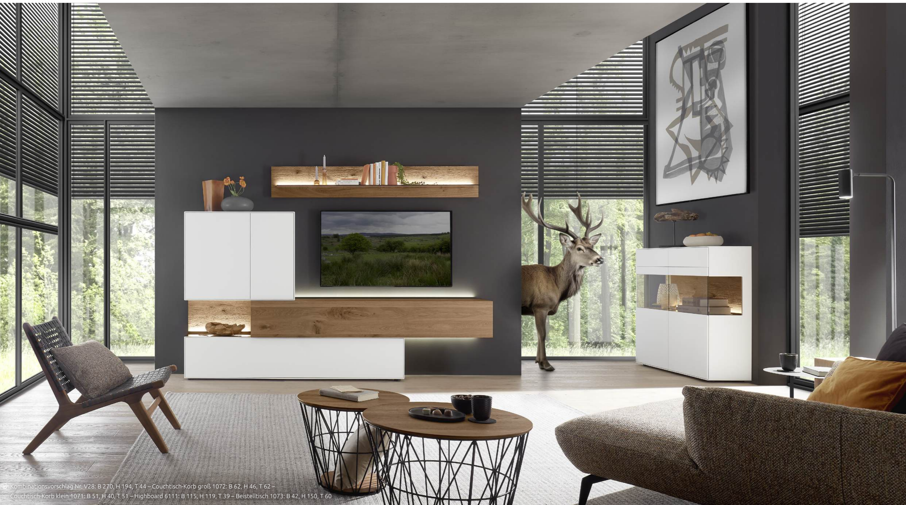
Kombinationsvorschlag Nr. V28: B 270, H 194, T 44 – Couchtisch-Korb groß 1072: B 62, H 46, T 62 – Couchtisch-Korb klein 1071: B 51, H 40, T 51 – Highboard 6111: B 115, H 119, T 39 – Beistelltisch 1073: B 42, H 150, T 60