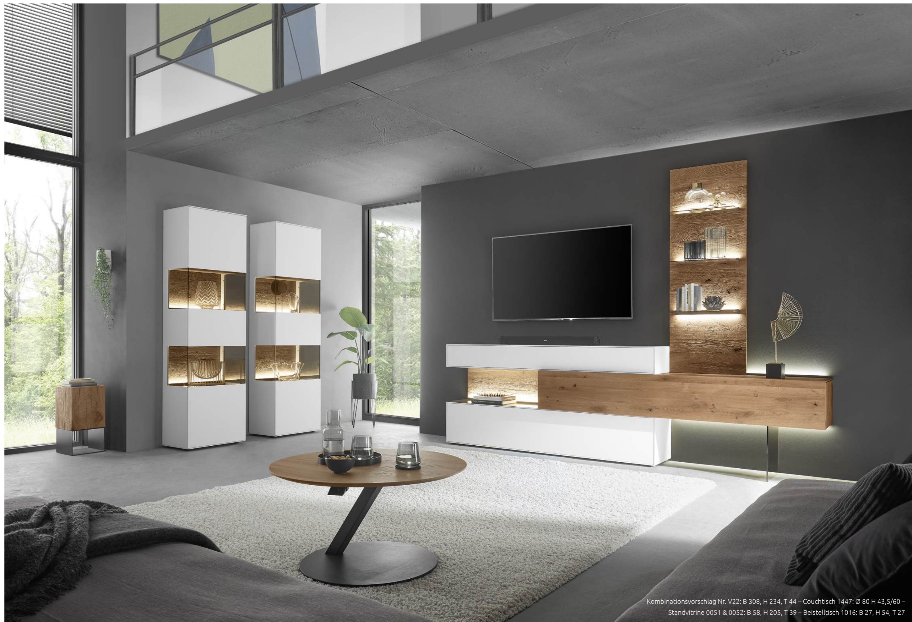
Kombinationsvorschlag Nr. V22: B 308, H 234, T 44 – Couchtisch 1447: Ø 80 H 43,5/60 – Standvitrine 0051 & 0052: B 58, H 205, T 39 – Beistelltisch 1016: B 27, H 54, T 27