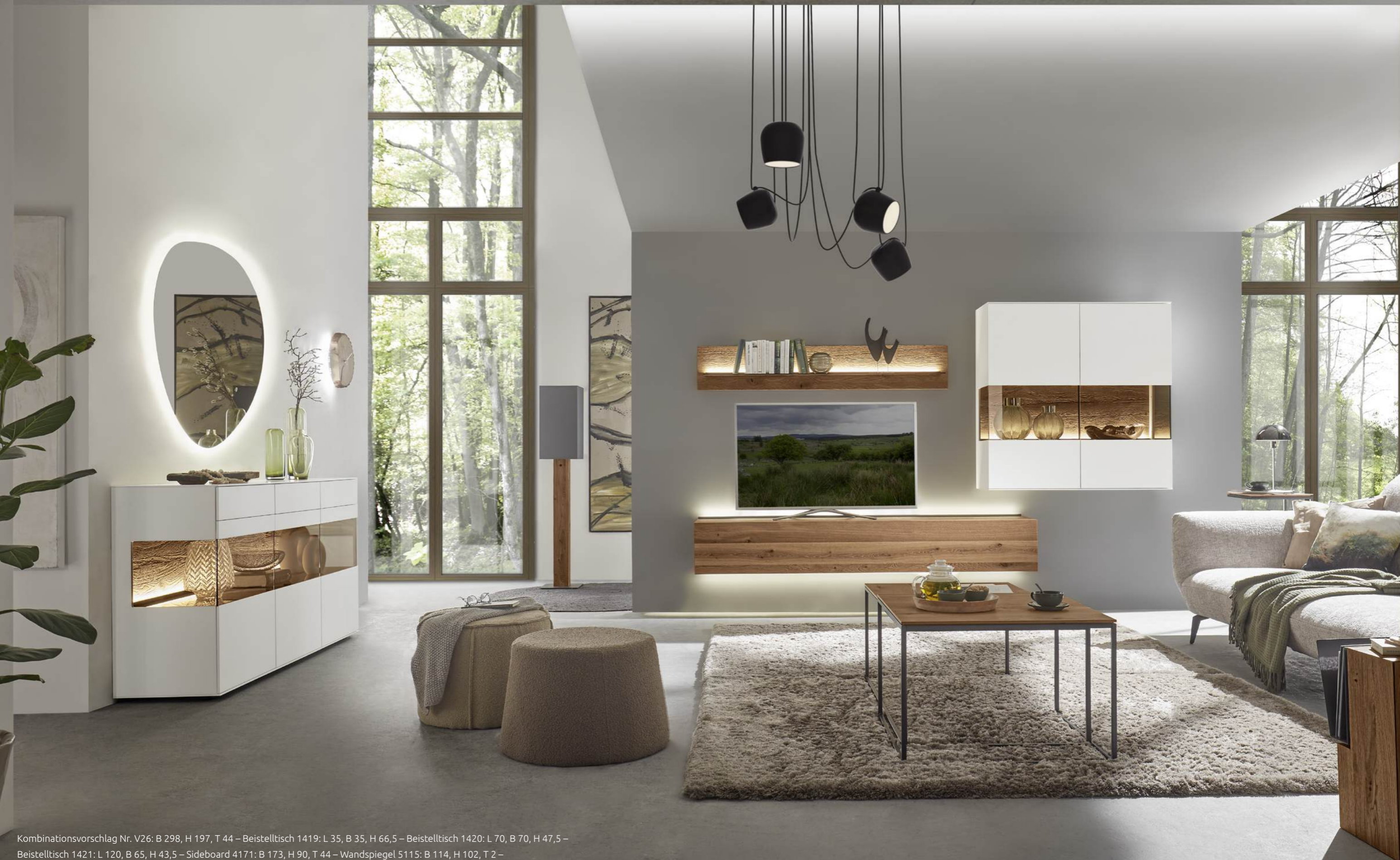
Kombinationsvorschlag Nr. V26: B 298, H 197, T 44 – Beistelltisch 1419: L 35, B 35, H 66,5 – Beistelltisch 1420: L 70, B 70, H 47,5 – Beistelltisch 1421: L 120, B 65, H 43,5 – Sideboard 4171: B 173, H 90, T 44 – Wandspiegel 5115: B 114, H 102, T 2 – Beistelltisch 1059: B 28, H 52, T 39 – Wanduhr 1006: B 35, H 36, T 7 – Stehleuchte 1053: B 30, H 166, T 30