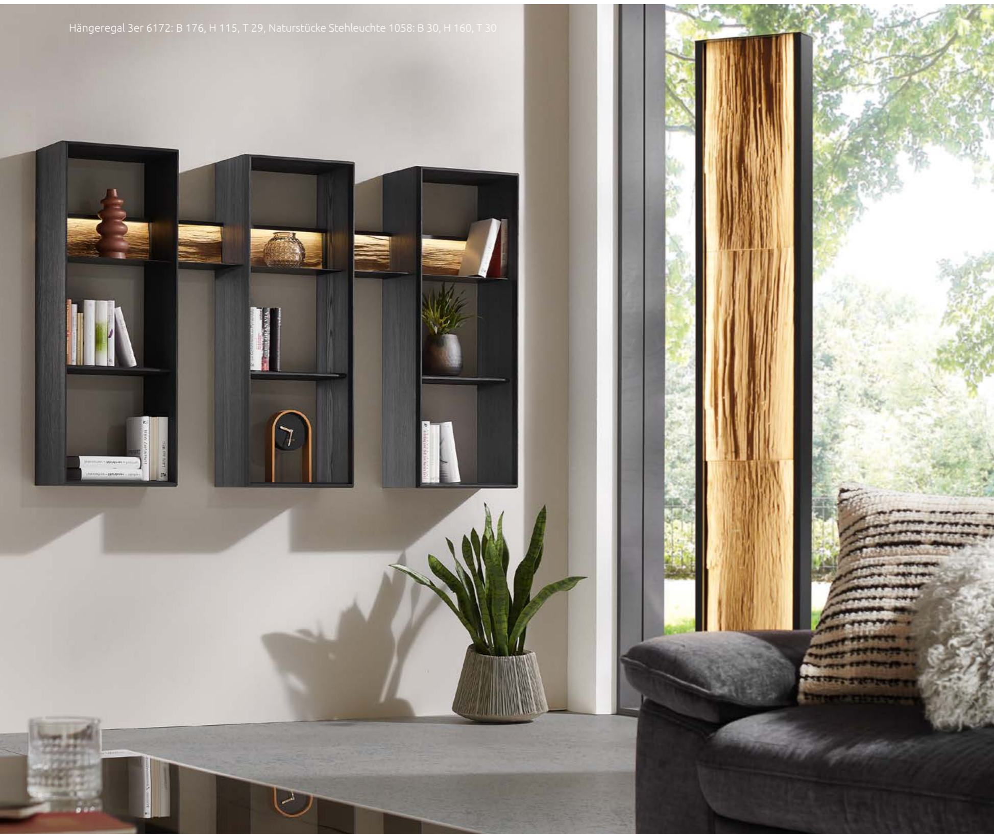
Hängeregal 3er 6172: B 176, H 115, T 29, Naturstücke Stehleuchte 1058: B 30, H 160, T 30