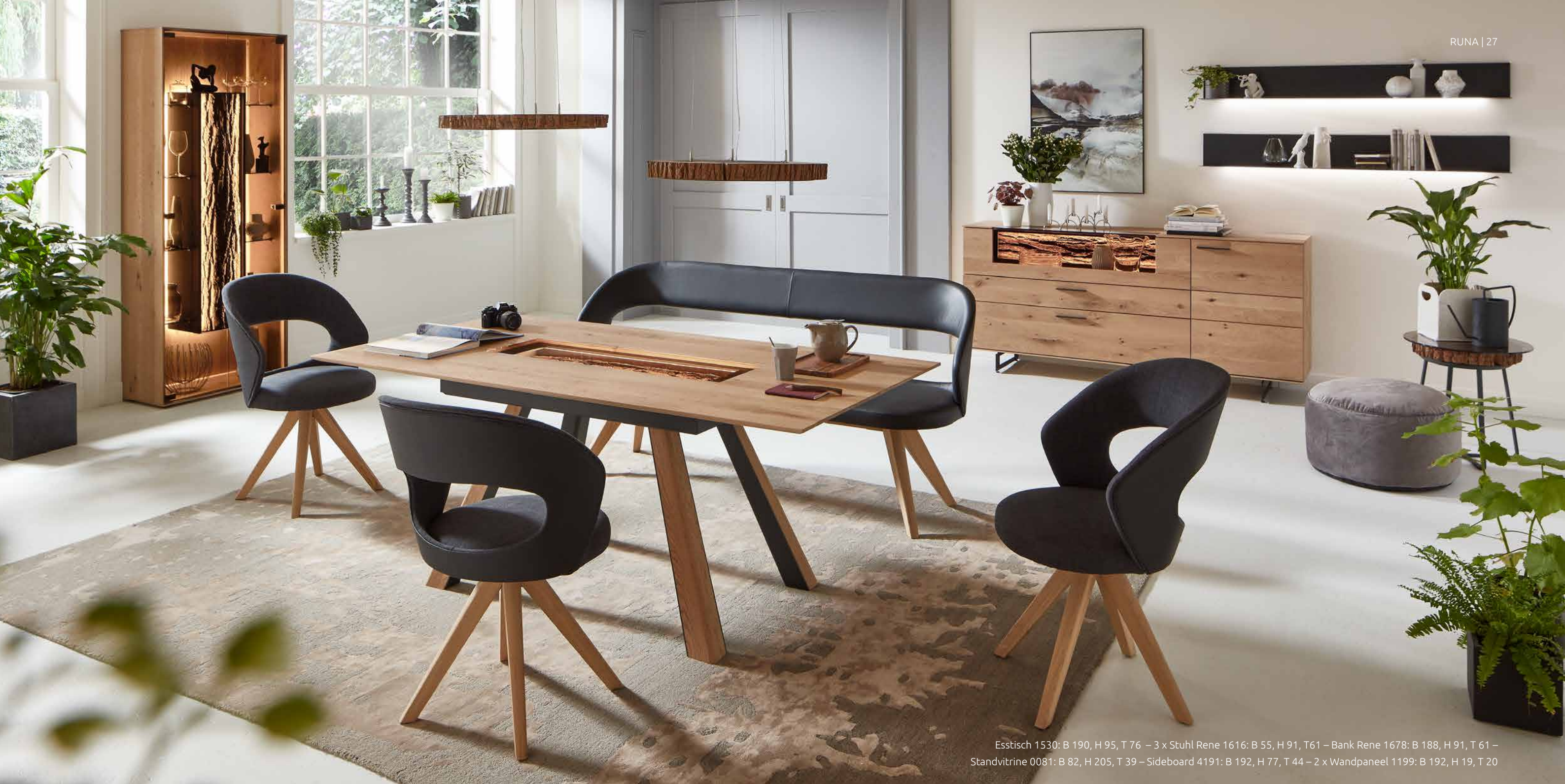
Esstisch 1530: B 190, H 95, T 76 – 3 x Stuhl Rene 1616: B 55, H 91, T 61 – Bank Rene 1678: B 188, H 91, T 61 – Standvitrine 0081: B 82, H 205, T 39 – Sideboard 4191: B 192, H 77, T 44 – 2 x Wandpaneel 1199: B 192, H 19, T 20