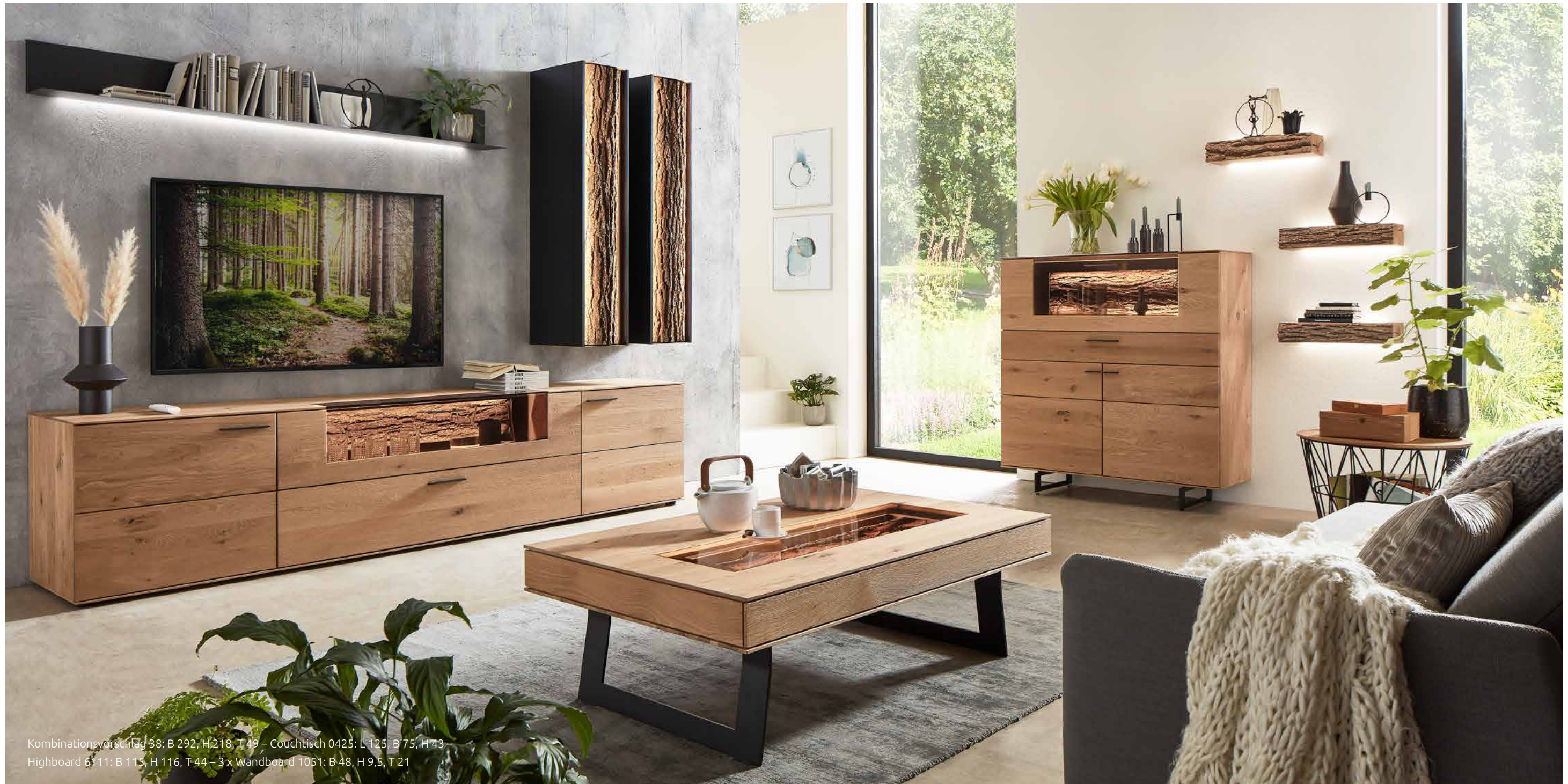
Kombinationsvorschlag 38: B 292, H 218, T 49 – Couchtisch 0425: L 125, B 75, H 43 – Highboard 6311: B 115, H 116, T 44 – 3 x Wandboard 1051: B 48, H 9,5, T 21