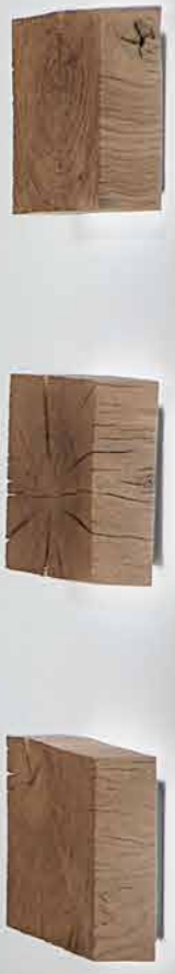
Kombinationsvorschlag Nr. 26: B 346, H 225, T 49/20 – Beistelltisch „Naturstücke“ 1011: Ø 28, H 46 – 3x Wand-Leuchte „Naturstücke“ 1061: B 27, H 27, T 10