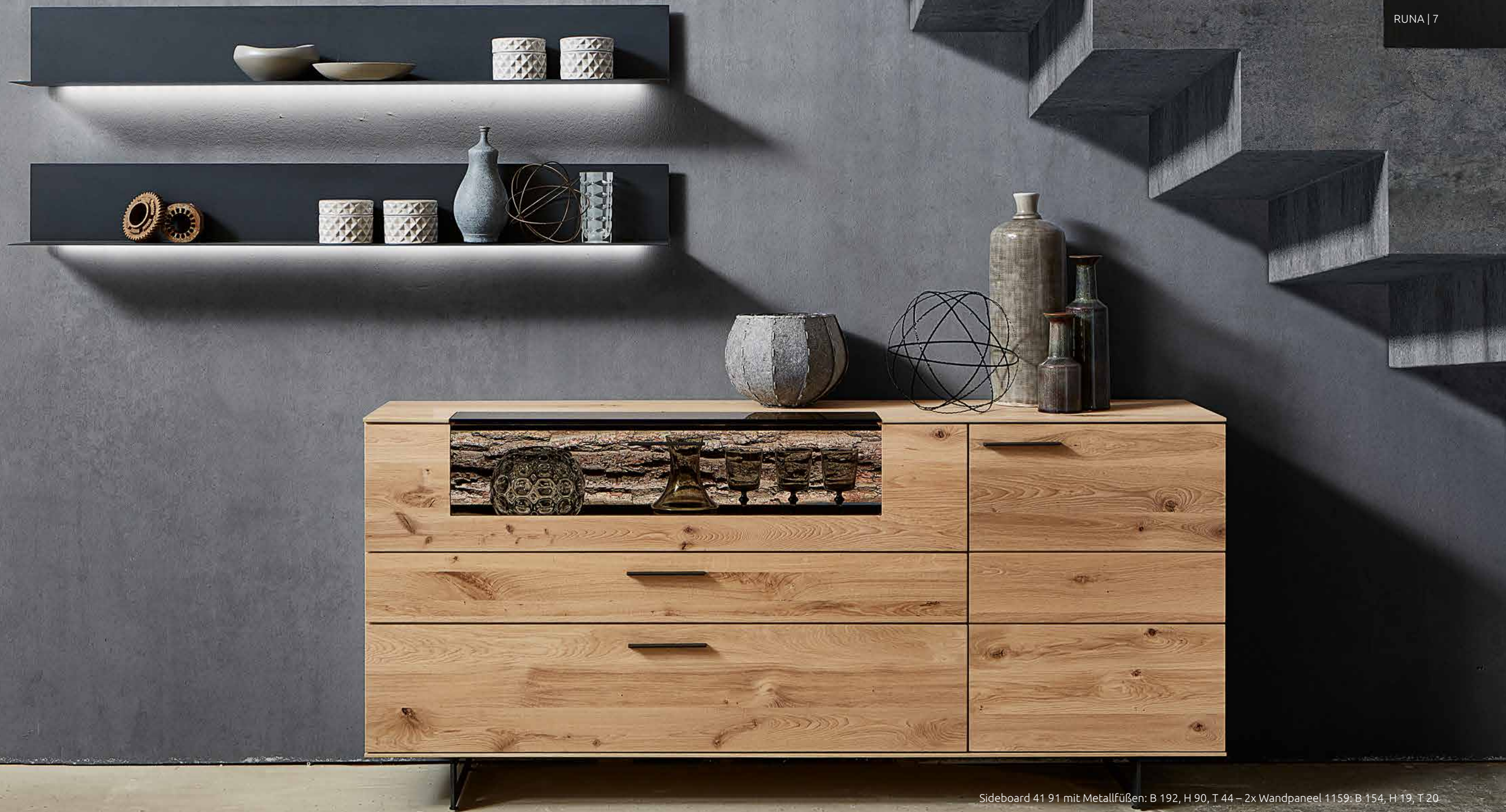
Sideboard 41 91 mit Metallfüßen: B 192, H 90, T 44 – 2x Wandpaneel 1159: B 154, H 19, T 20