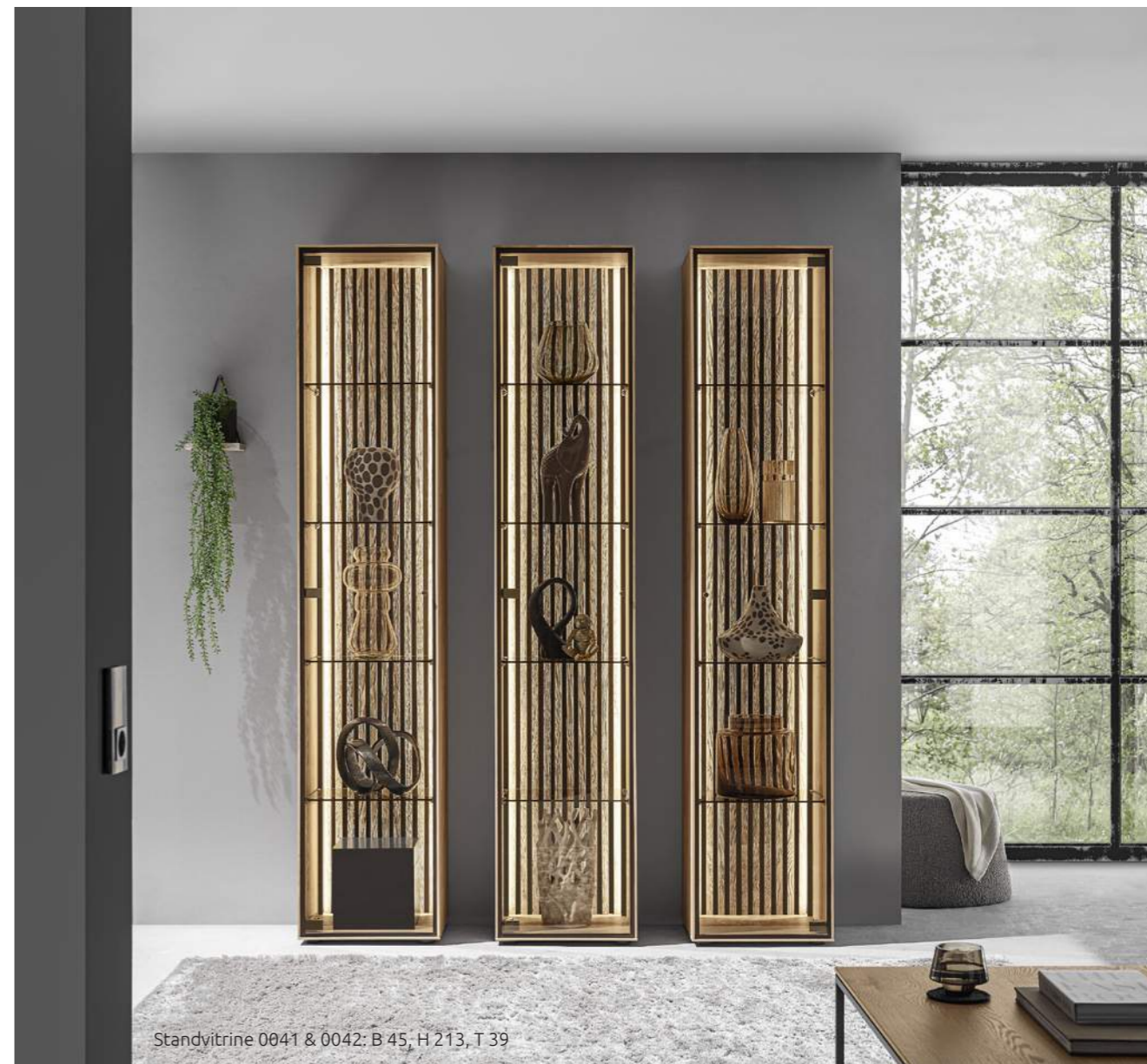
Standvitrine 0041 &amp; 0042: B 45, H 213, T 39