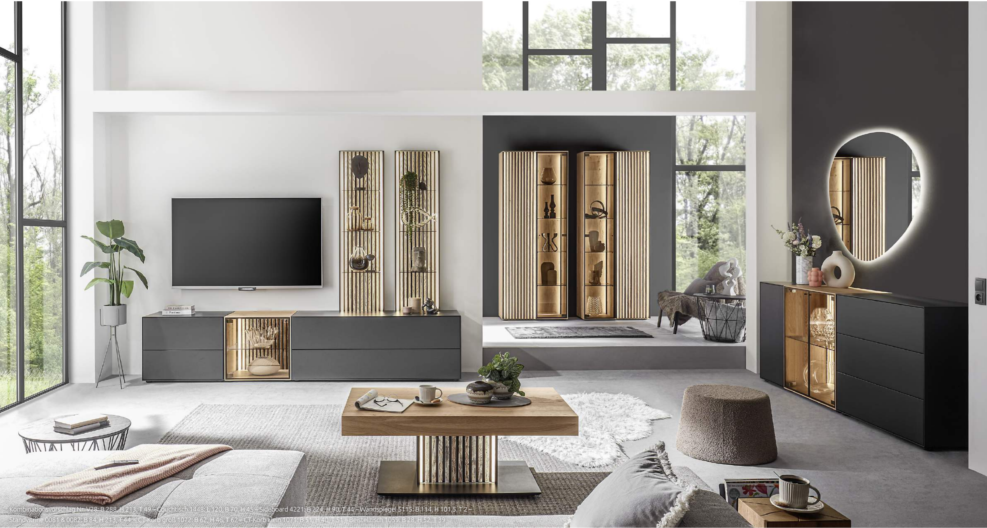
Kombinationsvorschlag Nr. V28: B 288, H 213, T 49 – Couchtisch 1448: L 120, B 70, H 45 – Sideboard 4221: B 224, H 90, T 44 – Wandspiegel 5115: B 114, H 101,5, T 2 – Standvitrine 0081 & 0082: B 84, H 213, T 44 – CT-Korb groß 1072: B 62, H 46, T 62 – CT-Korb klein 1071: B 51, H 40, T 51 – Beistelltisch 1059: B 28, H 52, T 39