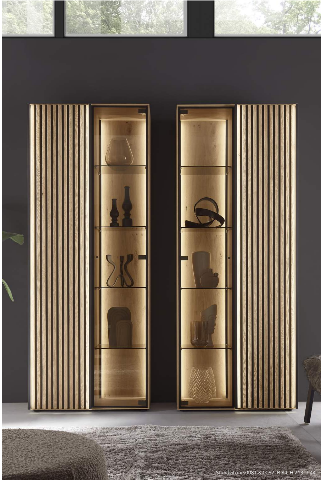
Standvitrine 0081 &amp; 0082: B 84, H 213, T 44