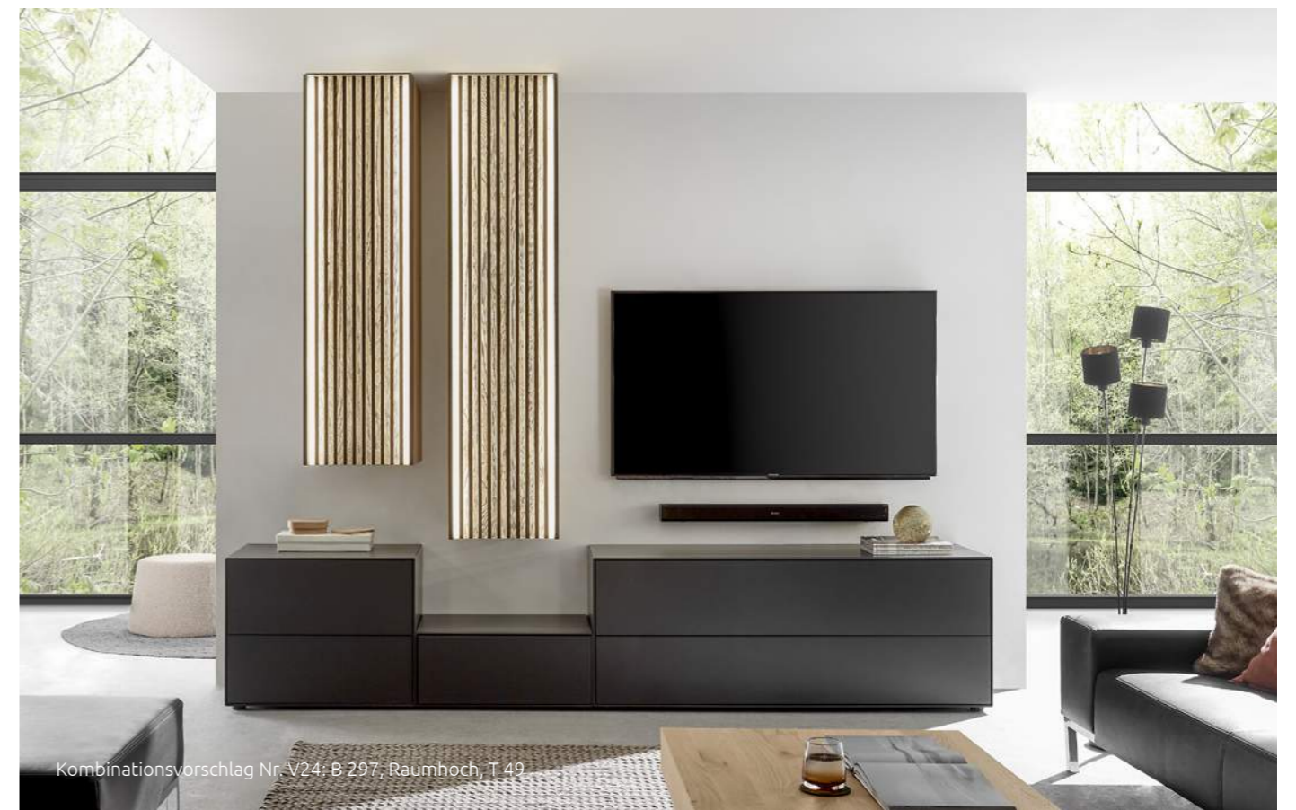
Kombinationsvorschlag Nr. V24: B 297, Raumhoch, T 49

Selino does not just empower your dream room, it also boosts your storage space options. Only your living room ceiling sets a natural limit. Your belongings will find a perfect spot behind the generous louvred doors and on the attractive glass shelving.