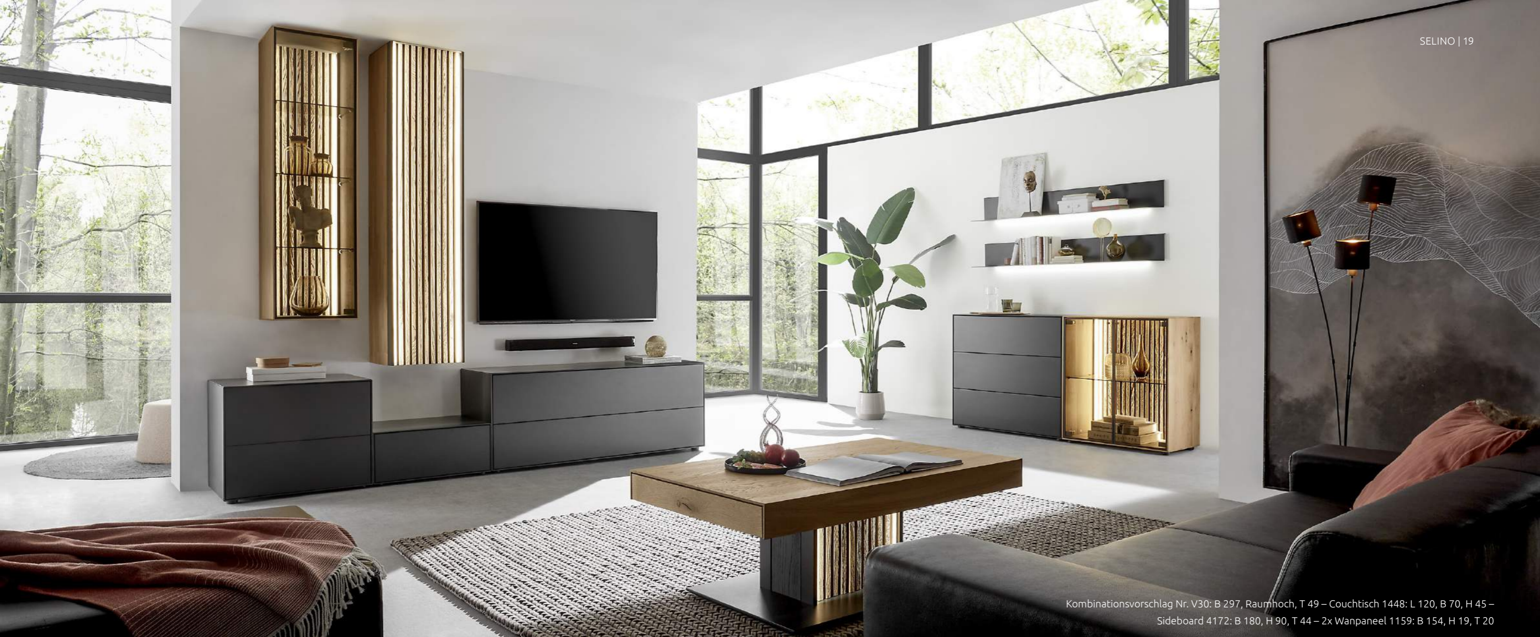
Kombinationsvorschlag Nr. V30: B 297, Raumhoch, T 49 – Couchtisch 1448: L 120, B 70, H 45 – Sideboard 4172: B 180, H 90, T 44 – 2x Wanpaneel 1159: B 154, H 19, T 20