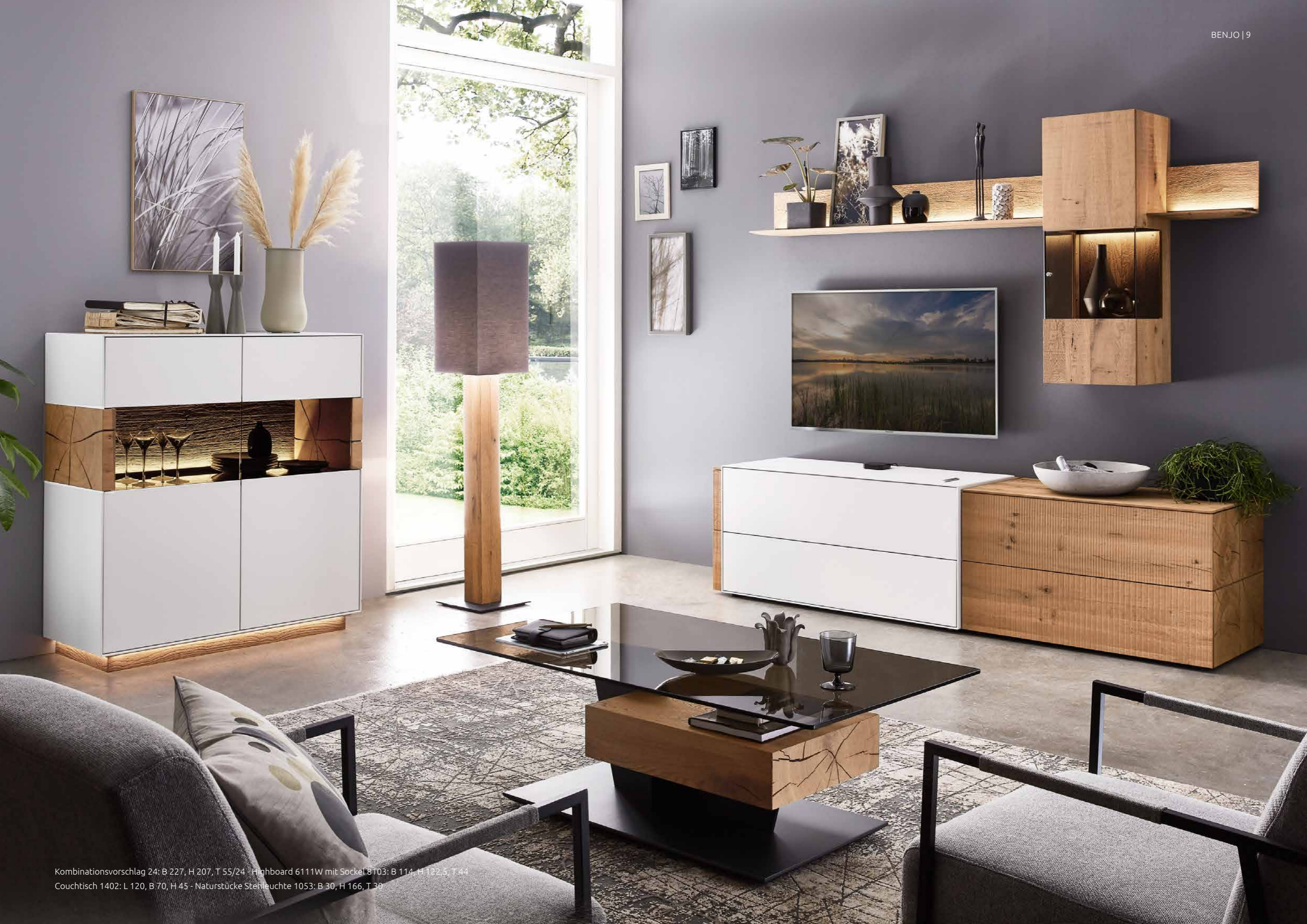
Kombinationsvorschlag 24: B 227, H 207, T 55/24 - Highboard 6111W mit Socket 8103: B 114, H 122,5, T 44 Couchtisch 1402: L 120, B 70, H 45 - Naturstücke Stehleuchte 1053: B 30, H 166, T 30