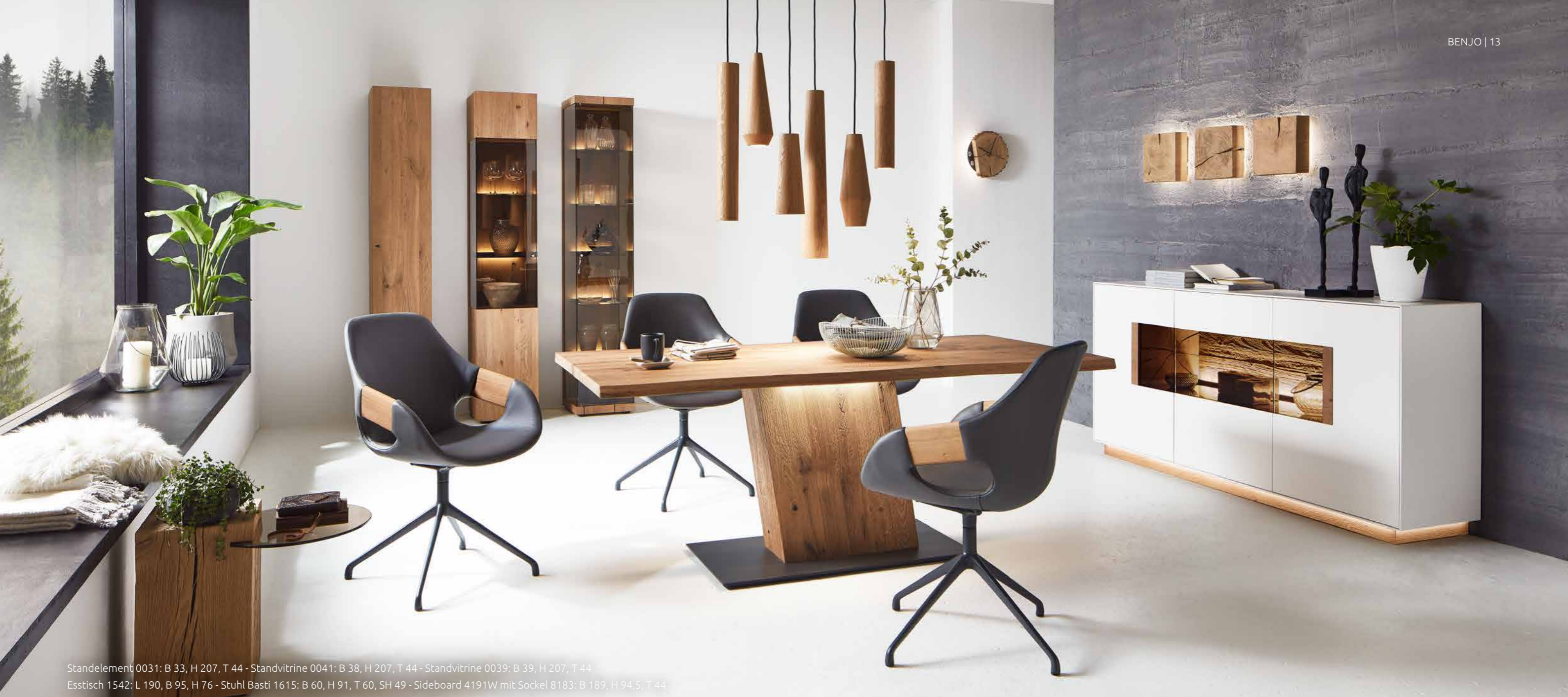
Standelement 0031: B 33, H 207, T 44 - Standvitrine 0041: B 38, H 207, T 44 - Standvitrine 0039: B 39, H 207, T 44 Esstisch 1542: L 190, B 95, H 76 - Stuhl Basti 1615: B 60, H 91, T 60, SH 49 - Sideboard 4191W mit Sockel 8183: B 189, H 94,5, T 44