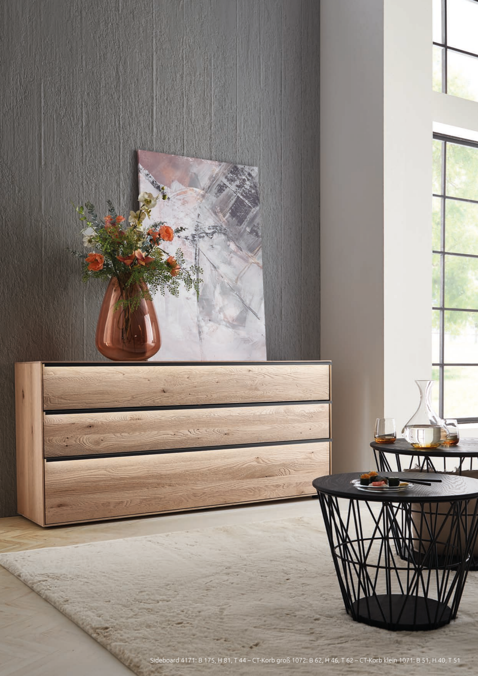
Sideboard 4171: B 175, H 81, T 44 – CT-Korb groß 1072: B 62, H 46, T 62 – CT-Korb klein 1071: B 51, H 40, T 51