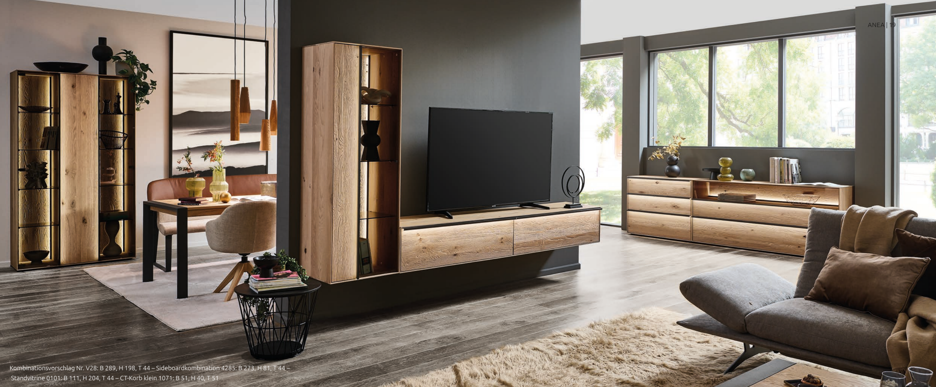
Kombinationsvorschlag Nr. V28: B 289, H 198, T 44 – Sideboardkombination 4285: B 273, H 81, T 44 – Standvitrine 0101: B 111, H 204, T 44 – CT-Korb klein 1071: B 51, H 40, T 51