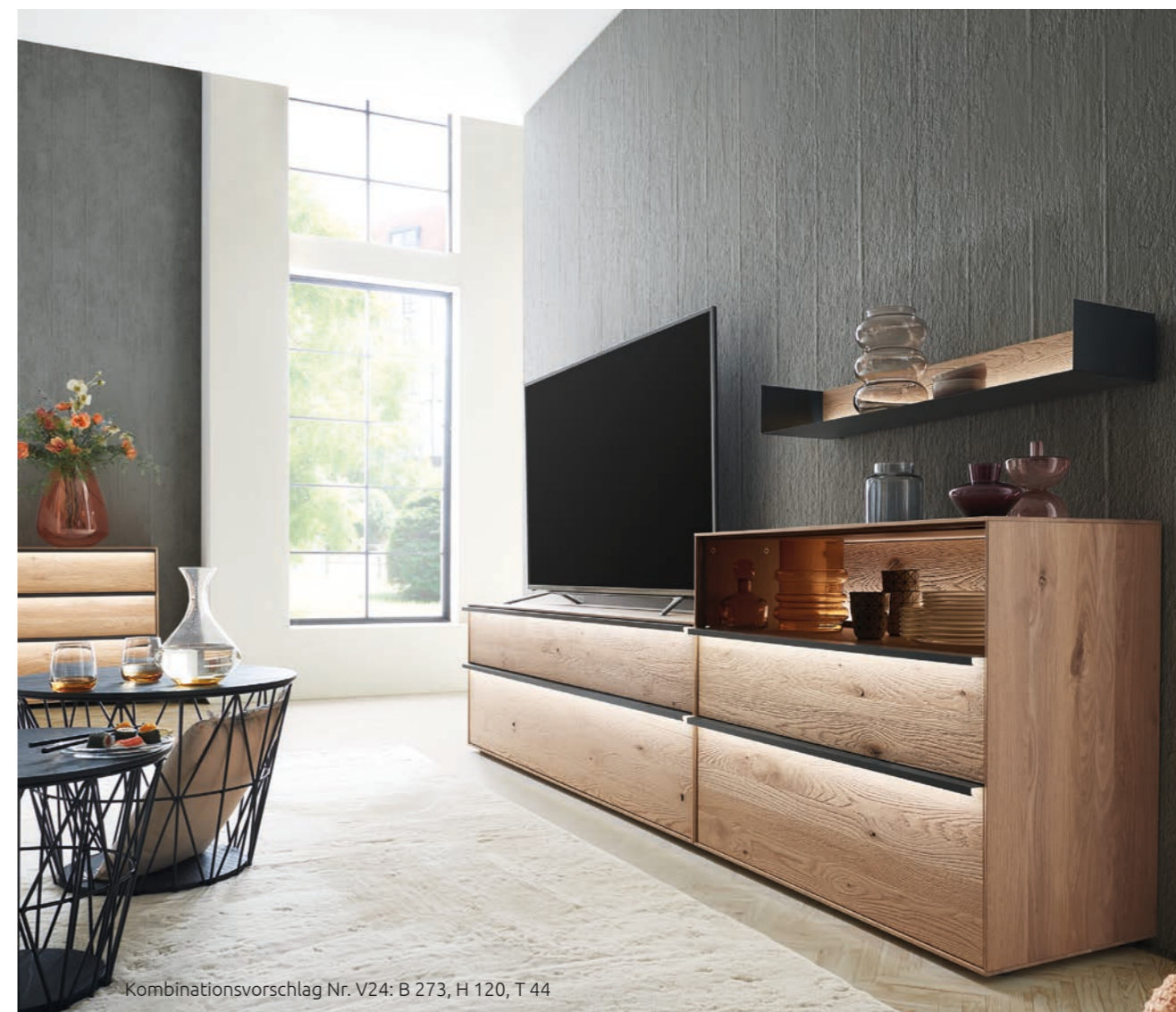
Kombinationsvorschlag Nr. V24: B 273, H 120, T 44