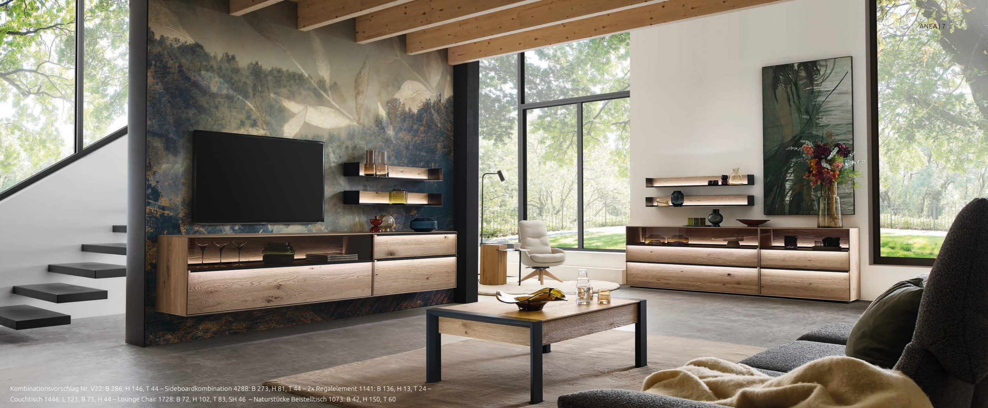
Kombinationsvorschlag Nr. V22: B 286, H 146, T 44 – Sideboardkombination 4288: B 273, H 81, T 44 – 2x Regalelement 1141: B 136, H 13, T 24 – Couchtisch 1446: L 121, B 75, H 44 – Lounge Chair 1728: B 72, H 102, T 83, SH 46 – Naturstücke Beistelltisch 1073: B 42, H 150, T 60