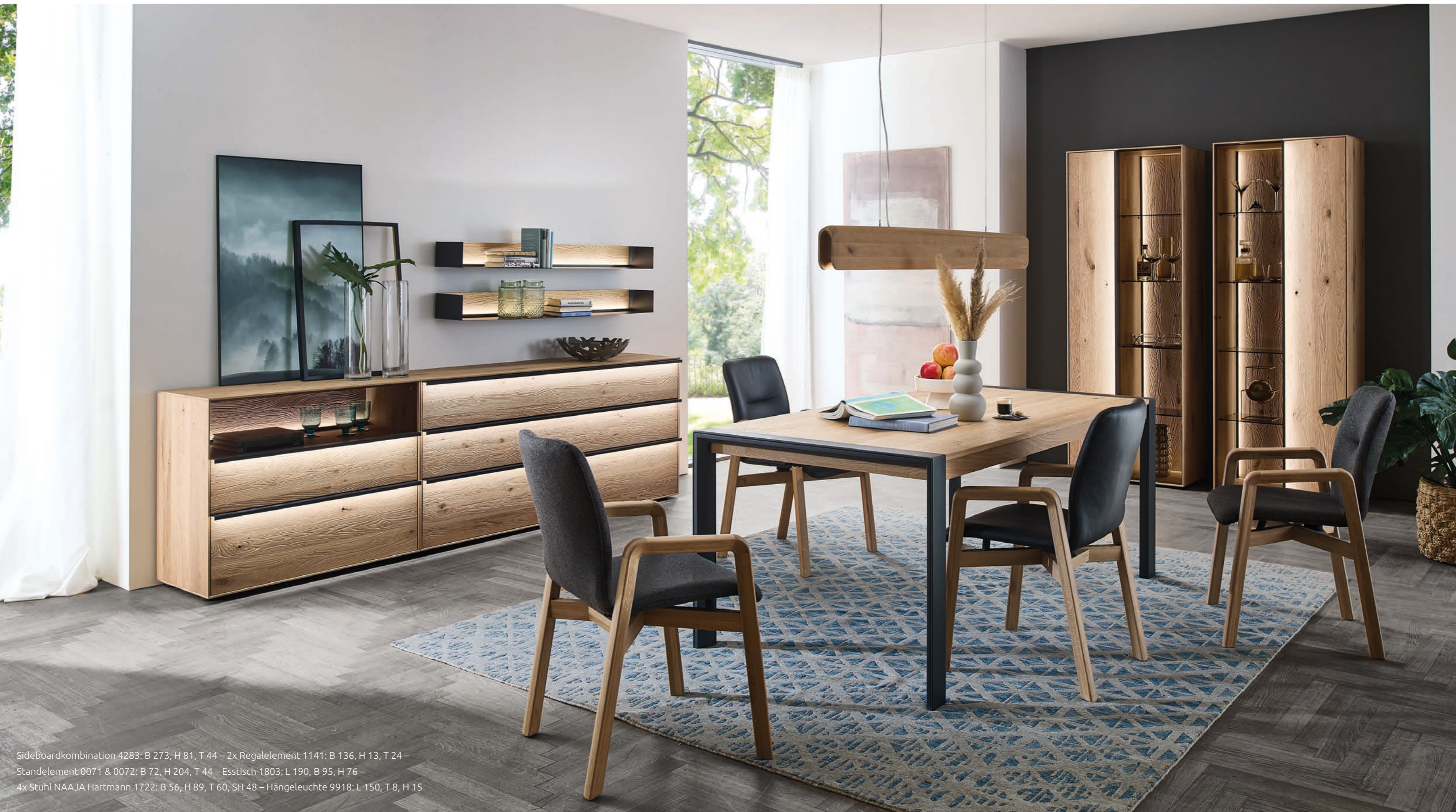
Sideboardkombination 4283: B 273, H 81, T 44 – 2x Regalelement 1141: B 136, H 13, T 24 – Standelement 0071 & 0072: B 72, H 204, T 44 – Esstisch 1803: L 190, B 95, H 76 – 4x Stuhl NAAJA Hartmann 1722: B 56, H 89, T 60, SH 48 – Hängeleuchte 9918: L 150, T 8, H 15