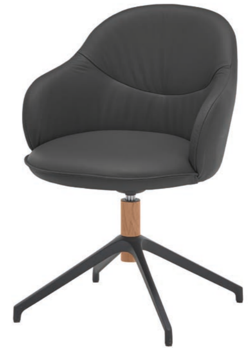
Stuhl RICO Hartmann 1719: B 61, H 84, T 63, SH 50

The Rico chair impresses with its stylish design and offers a valuable ergonomic benefit by promoting a healthy sitting posture. Just like a gymnastic ball, the elastic active suspension feature keeps you constantly moving, thus relieving the intervertebral discs and improving blood circulation. In addition, the micro-movements train your back muscles, thereby preventing posture-related damage, thus protecting your back.